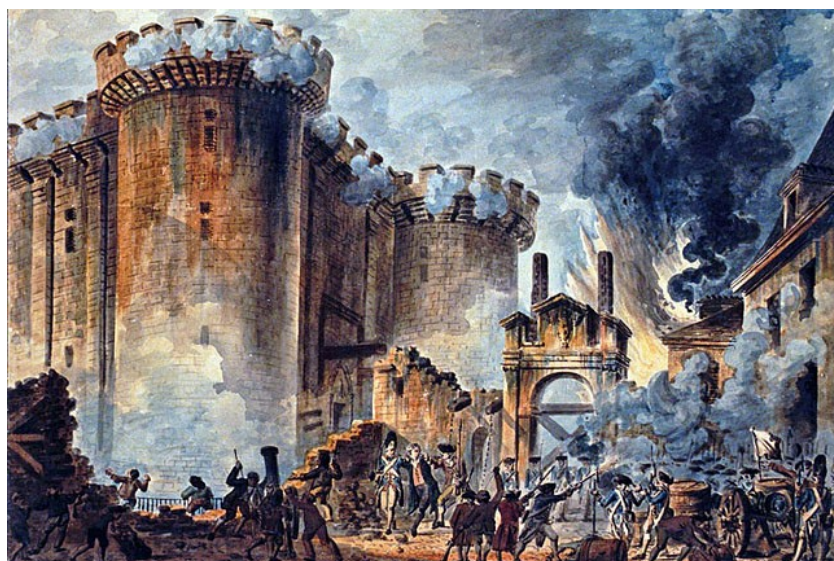
Bastille ostroma (1789.júl.14)