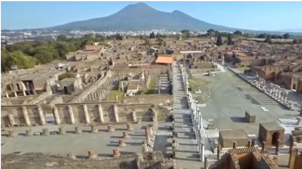
Pompeii pusztulása 79-ben

A császárság korszakai és fontosabb dinasztiái