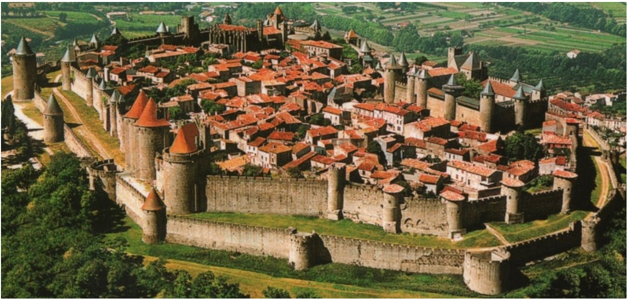
Carcassonne középkori város (Franciaország)