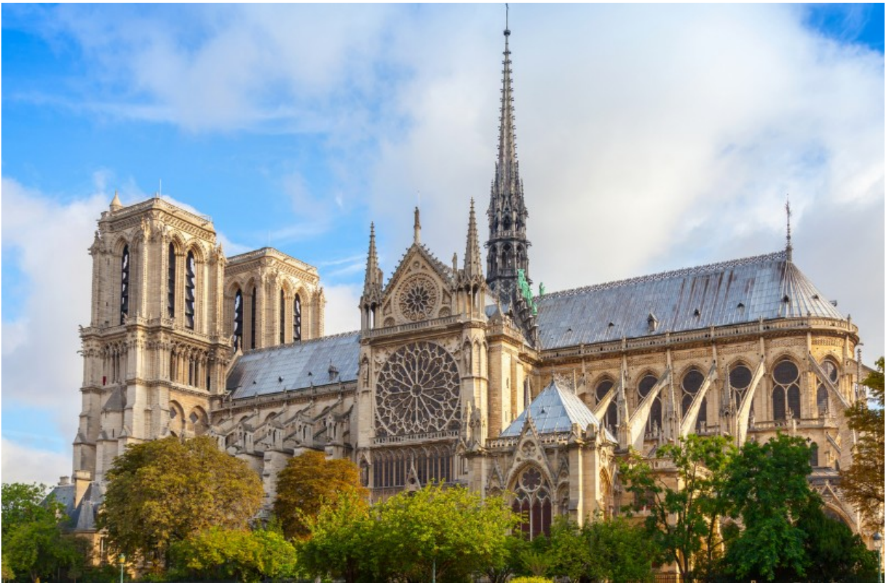
párizsi Notre Dame