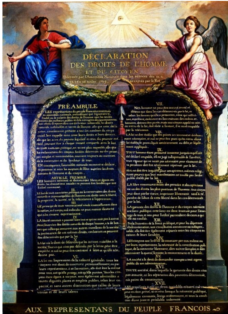
Emberi és polgári jogok nyilatkozata (Franciaország 1789)