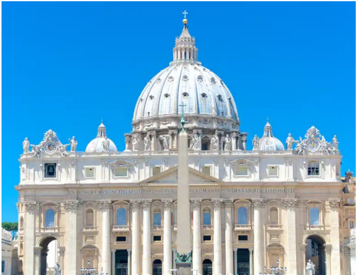
a Szent Péter Bazilika szimmetriája (Róma)