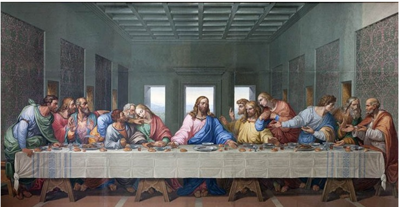
Leonardo da Vinci – Utolsó vacsora