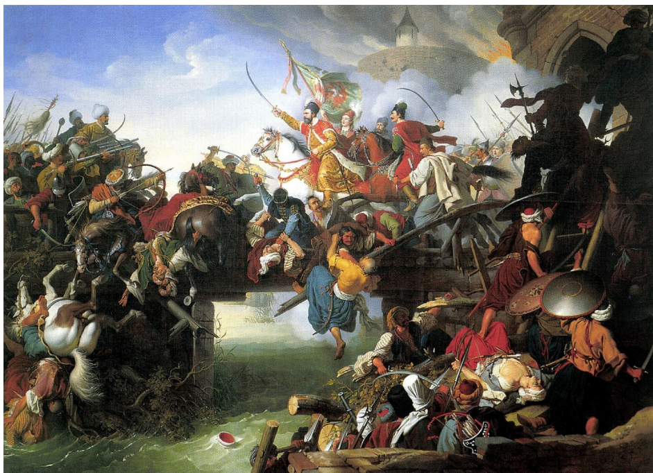
Zrínyi Miklós kirohanása 1566 Szigetvár